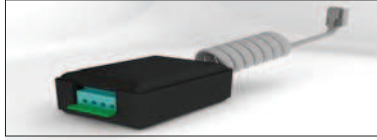
KIT INTERFACE ALARMA ALARM INTERFACE KIT KIT INTERFACE ALARME