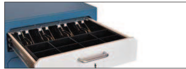
CAJÓN SUPERIOR UPPER DRAWER TIROIR SIUPÉRIEUR