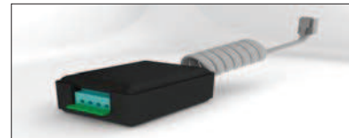
KIT INTERFACE ALARMA ALARM INTERFACE KIT KIT INTERFACE ALARME