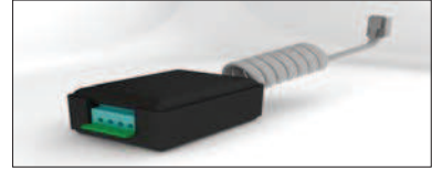
KIT INTERFACE ALARMA ALARM INTERFACE KIT KIT INTERFACE ALARME