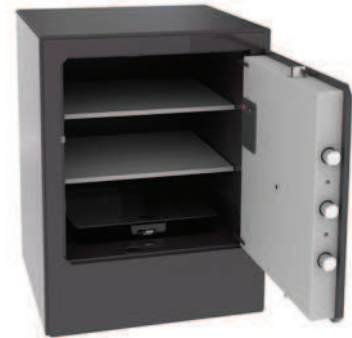
COMPARTIMIENTO INTERIOR OCULTO (S1005) INSIDE HIDDEN COMPARTMENT (S1005) COMPARTIMENT CACHÉ À L'INTÉRIEUR (S1005)

Niveau de sécurité élevé. Ajustement parfait entre la porte et le cadre avec un design innovant.